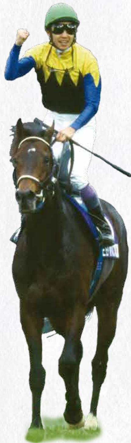
ディープインパクト (2006年ジャパンカップ)

※1954年～1971年は啓衆社、1972年～1986年はJRA発行『優駿』誌。1987年以降はJRA主催